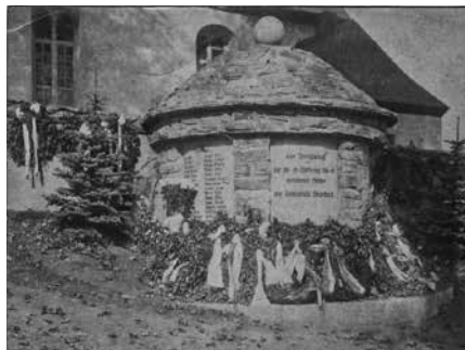
Einweihung des Kriegerdenkmals in Grumbach 1924