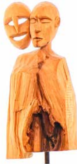
Die vielsagende Kleinplastik von Maik Mischau