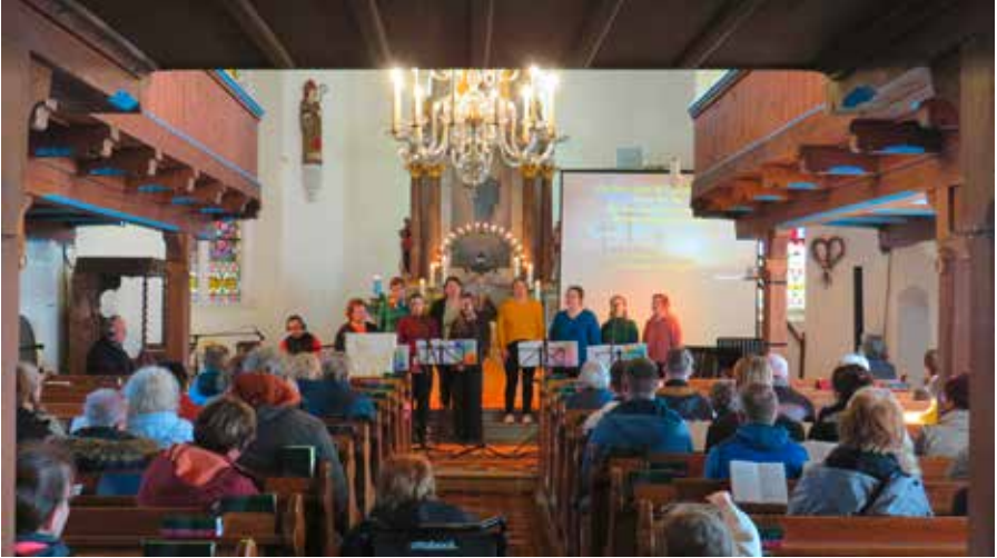
Gottesdienst mit dem Gospelchor am Ostermontag in Grumbach